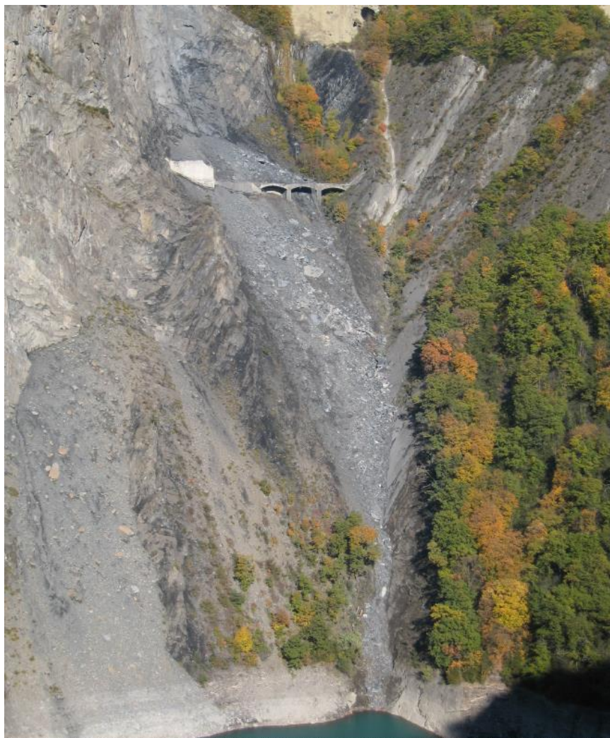
La Clapisse après l'éboulement du 26 octobre 2010.

En 2010, un éboulement de très grande ampleur a lieu sur le lieu-dit « La Clapisse » obligeant à l'arrêt de l'exploitation de la ligne ferroviaire.