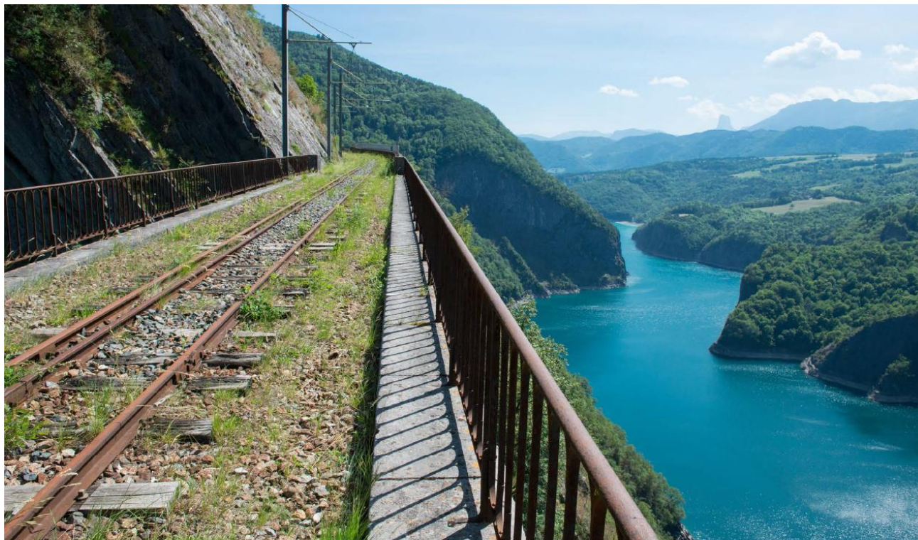
Le site du Grand Balcon : vue sur le lac de Monteynard.